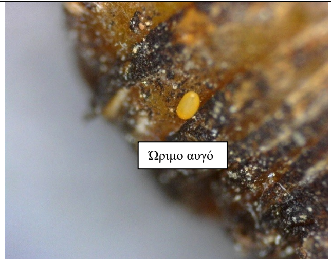
Αυγά Cacopsylla pyri