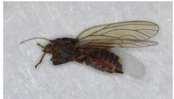
Θηλυκό Cacopsylla pyri