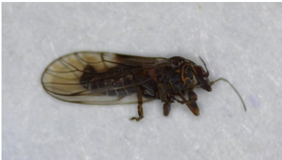
Αρσενικό Cacopsylla pyri