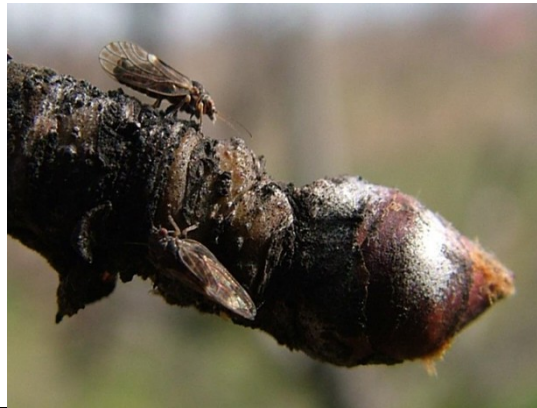
Ακμαία Cacopsylla pyri

Εάν προστεθεί μαζί με το λάδι ένα πυρεθροειδές η αποτελεσματικότητα μπορεί να φτάσει το 98%. Τα πυρεθροειδή έχουν ακμαιοκτόνο δράση. Τα θηλυκά άτομα είναι πιο ευαίσθητα στα εντομοκτόνα όταν φέρουν αυγά. Τα λάδια αυξάνουν την αποτελεσματικότητα των εντομοκτόνων και μειώνουν την πιθανότητα ανάπτυξης ανθεκτικότητας της ψύλλας στα πυρεθροειδή. Σαν αποτρεπτικό ωοτοκίας μπορεί να χρησιμοποιηθεί και ο καολίνης.