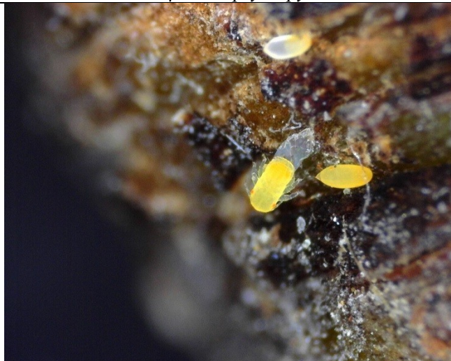
Εκκόλλαση αυγού Cacopsylla pyri