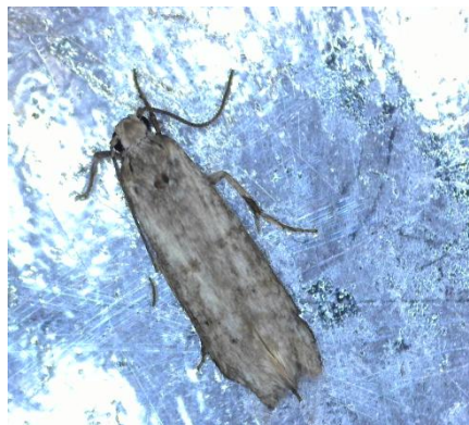
Πυρηνοτρήτης ( Prays oleae )