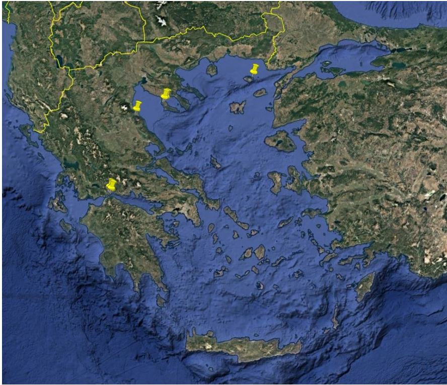
Εικόνα 1. Εστίες Ευλογιάς (Αναφορές ADIS Αρ. 2025/053 έως 2025/067).

Κατόπιν διαβούλευσης με τις αρμόδιες υπηρεσίες της Ευρωπαϊκής Επιτροπής, θα ενσωματωθούν στο Παράρτημα της Εκτελεστικής Απόφασης (ΕΕ), αναφορικά με ορισμένα μέτρα έκτακτης ανάγκης σχετικά με την ευλογία των αιγοπροβάτων και οριοθετούνται οι παρακάτω ζώνες στις Π.Ε. Έβρου, Ροδόπης, Ξάνθης, Καβάλας, Δράμας, Χαλκιδικής, Μαγνησίας και Σποράδων, Φθιώτιδας, Φωκίδας, Αιτωλοακαρνανίας, στη Μητροπολιτική Ενοότητα Θεσσαλονίκης και στον Δήμο Σαμοθράκης ως ακολούθως (Εικόνα 2):